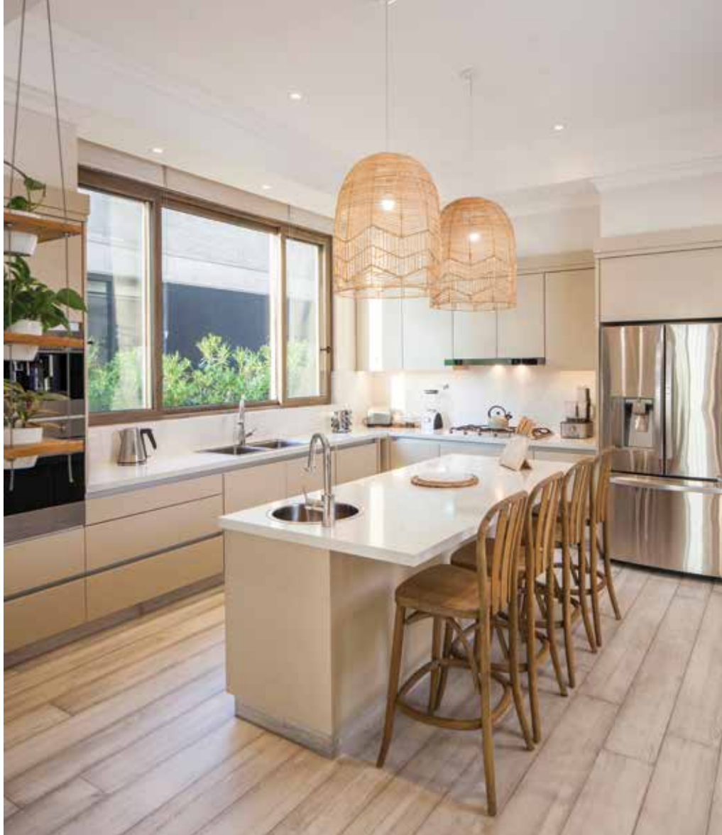
Los revestimientos de piedra en la gama de los beige favorecen la luminosidad interior